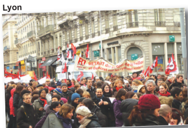
Haute-Garonne, motion adoptée par l'assemblée générale de grève

Les syndicats départementaux du SNUDI-FO soulignent que partout, la mobilisation a été très importante voire bien souvent « historique ». La balle est dans le camp du ministre. ■