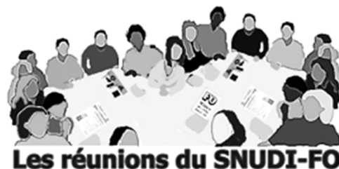
Les réunions du SNUDI-FO