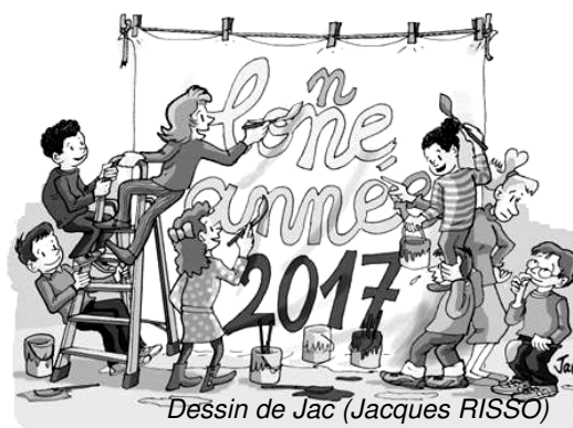
Dessin de Jac (Jacques RISSO)

Dans ce bulletin, compte-rendus, infos, analyses, ... Pour + d'actualité, + d'infos, ... le site : www.snudifo13.org